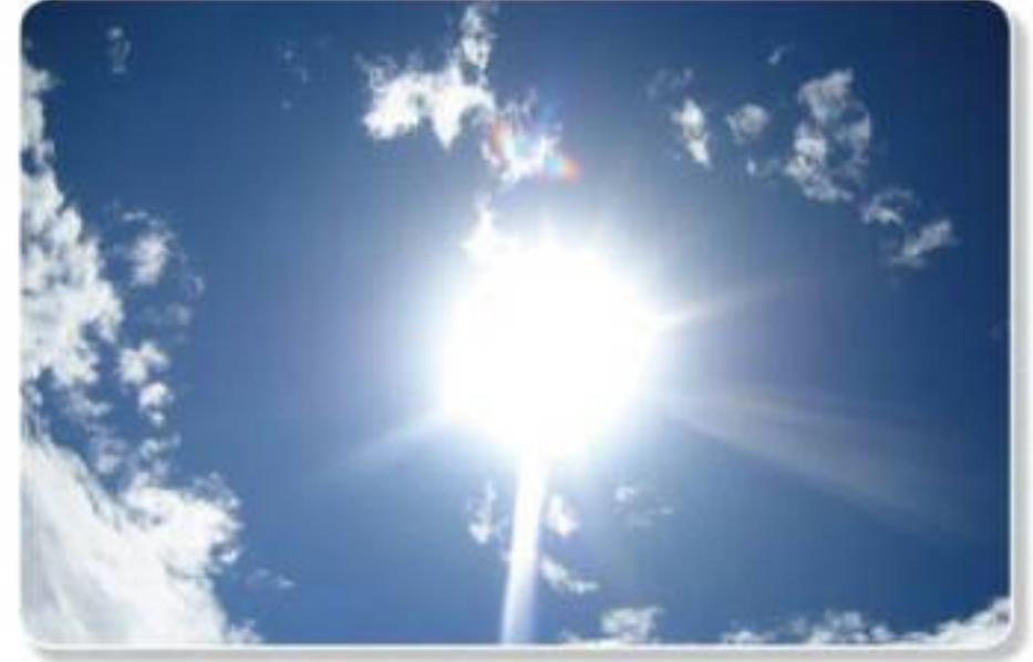
تعرّف مع مُعلِّمك كيفية زوالِ الشَّمْسِ