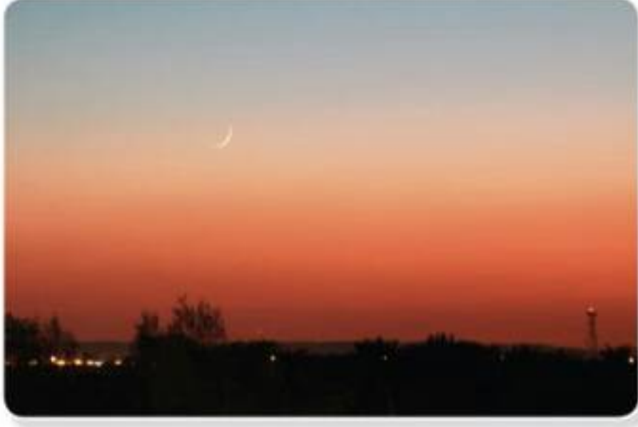
تعرّف مع أبيك الشَّفَقَ الأحمر