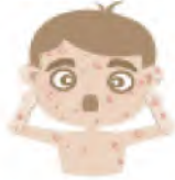
جُدْرِيّ المَاءِ (المنقز)